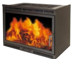
Kaminkassette oben: 2-seitig offen. Kaminkassette unten: 1-seitig offen.

Mehr Komfort bedeutet auch mehr Sicherheit. Mit einer Kaminkassette können Sie die Kaminatmosphäre genießen – und das Feuer auch einmal unbeaufsichtigt brennen lassen. Nur noch ein geringer Anteil an Verbrennungsluft wird dem Feuer nun über den Luftregler der Kaminkassette zugeführt. Sie sorgen so für einen umweltgerechten Abbrand, sparen Holz und bekommen wesentlich weniger Ascheanfall.